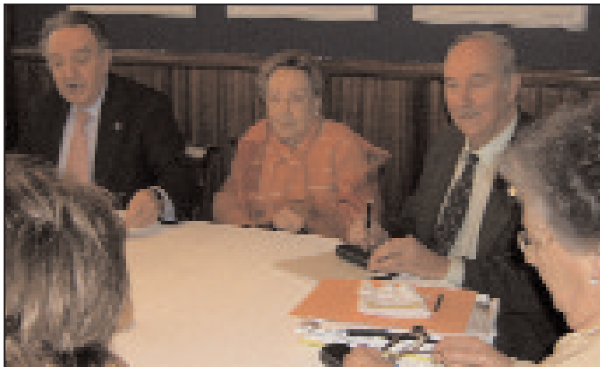
La Junta Directiva y Presidentes durante la reunión

Se ha fijado ya fecha y lugar para la cele-