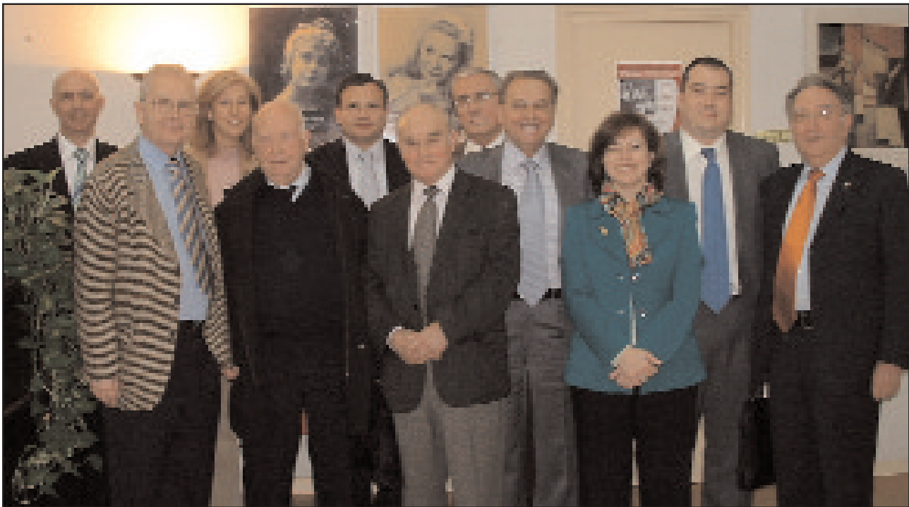
Miembros del Comité Científico y de Calidad de la Fundación