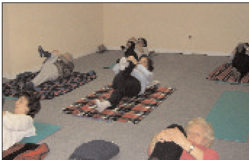
Clase de yoga desarrollada durante el presente curso