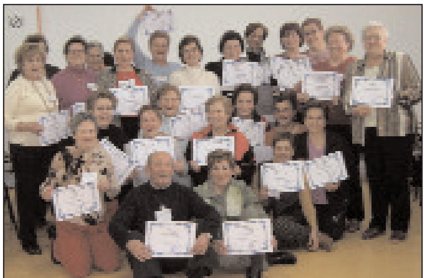
Arriba, los participantes en la excursión sensorial y, abajo, posando con los diplomas entregados