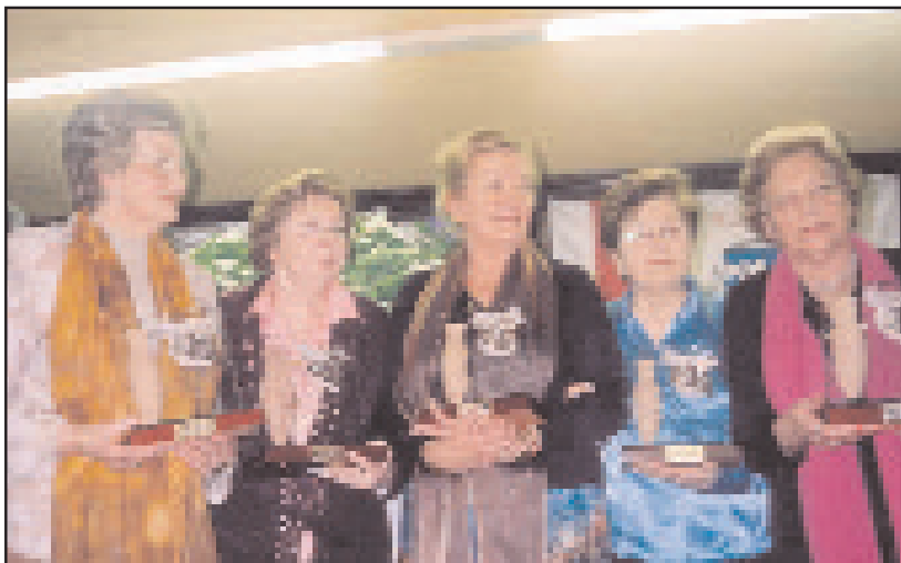
Ganadoras del IV Certamen

Felicidad, f.s.: Una señora muy guapa que vive en Carandia. ¡Arrea! Y luego dicen que no existe. Si hasta puede haber más de una. Ejemplo: ¡Plom! ¡Plom! ¡Plom! ¡Horror, el Tiranosaurio Rex! Pues no. Es mi hijo bajando por la escalera. Es... ¡una felicidad! Y ¿ese alegre relincho de pony feliz? ¡Ji, Ji, Ji! Es la risa de mi hija. Otra... ¡felicidad! Y ¿ese trino de malvís que deleita nuestros oídos? Es mi marido cantando... “Están clavadas dos cruces en el monte del olvido...”. ¡Mucha más felicidad! Son pequeñeces. Porque la felicidad, dicen, se alimenta de cosas pequeñas. ¿Y los que tienen casas, coches, barcos, fincas, y todo grande? ¡Huy los pobrucos...! Porque ya sabéis lo del camello y el culo de la aguja, y que la felicidad final y verdadera está donde éstos no pasarán. Eso dicen... . Bueno, como se me acaba el papel, pues la despedida feliz con mis deseos más felices. Que la felicidad nos empuje, nos arrastre y nos envuelva como una ola de Liencres en este 2006. Y los que vengan.